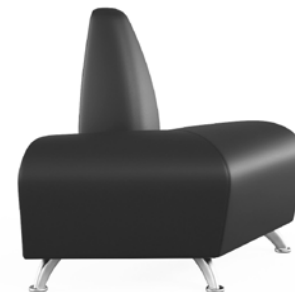
наружный угловой модуль