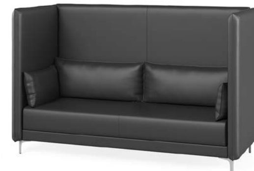
высокий трехместный диван