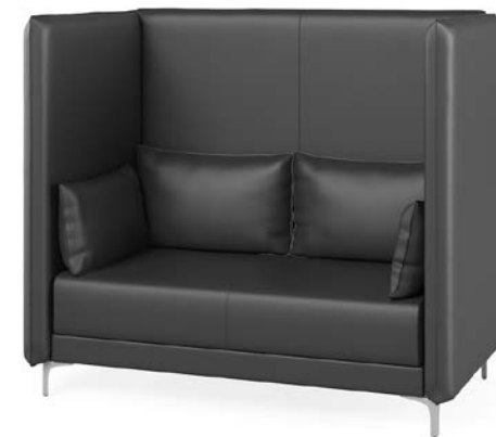
высокий двухместный диван